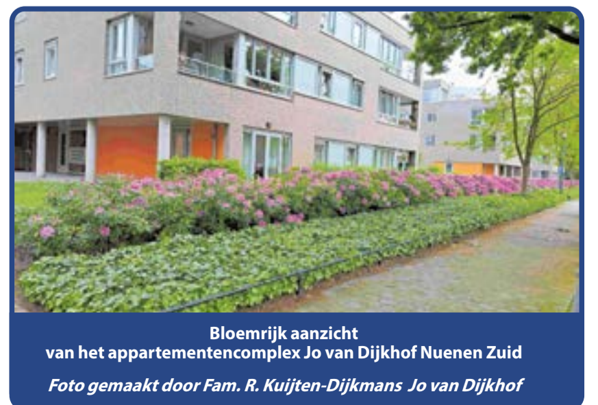
Bloemrijk aanzicht van het appartementencomplex Jo van Dijkhof Nuenen Zuid